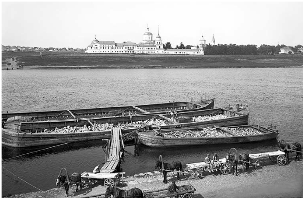
ТВЕРСКОЙ У. е . . . О . . . а . . . Ф . . . г а . . . 1903 г.