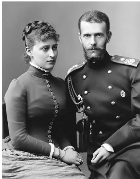
ВЕЛИКИЙ князь Сергей Александрович и великая княгиня Елисавета Феодоровна