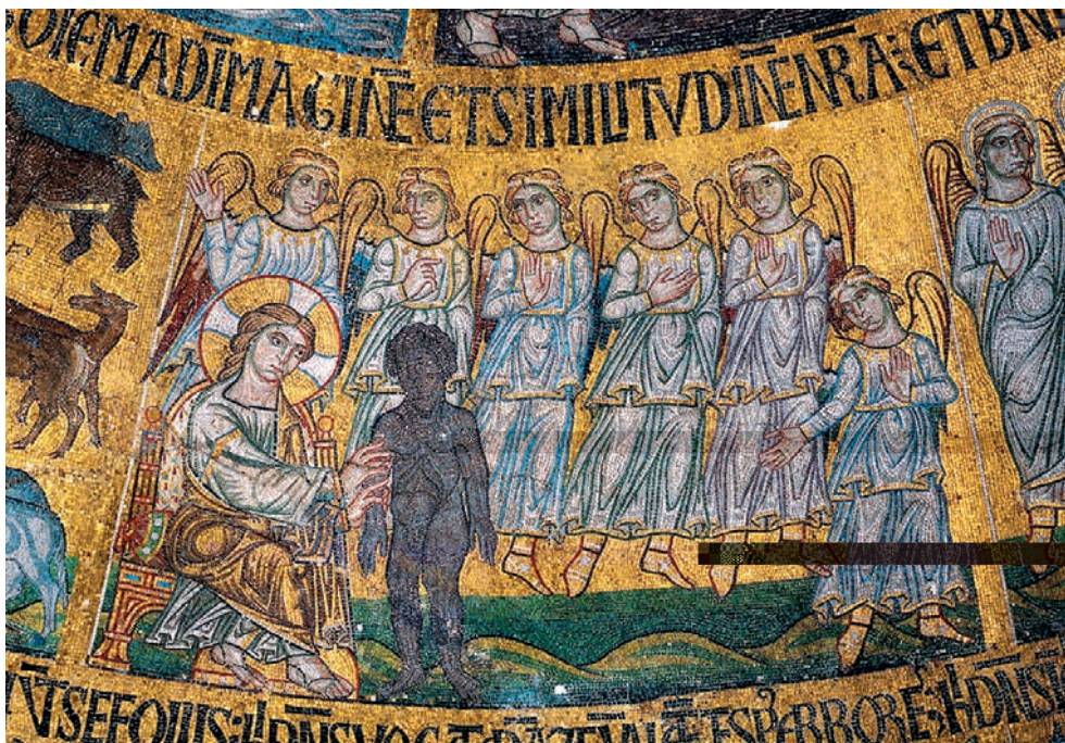
И СОЗДАЛ Господь Бог человека из праха земного... (Быт. 2:7). Собор св. Марка. Венеция. XIII в.

Перед тем, как начать изложение данной темы, рассмотрим, каким образом Вышенский Затворник рассуждает о возможности наблюдения за