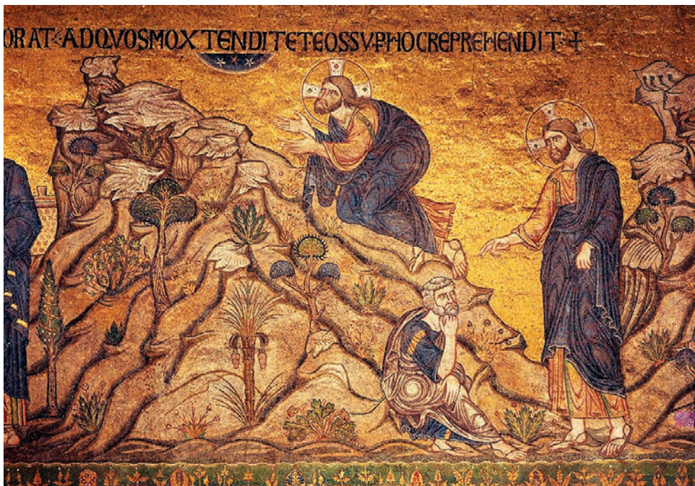
НЕ МОЯ ВОЛЯ, но Твоя да будет (Лк. 22:42): Моление о чаше. Собор св. Марка. Венеция. XIII в.

Следует отметить, что добродетель любви находится во взаимосвязи с добродетелью смирения. Святые отцы так говорят об этом: «Первая возносит [к Богу — Авт. ], а последнее вознесенных поддерживает и не дает им падать» 16 . Эту же мысль мы обнаружим и у святителя Феофана, который уделяет внимание не только пастырской любви, но и «смирному о себе мудрованию».