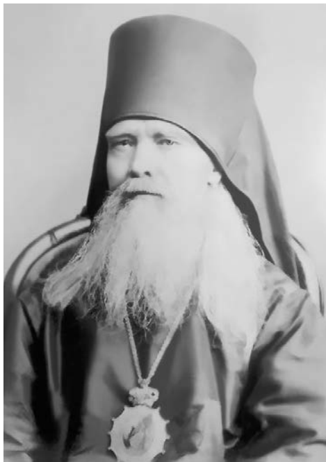
СВЯТИТЕЛЬ Феофан Затворник

Одну из внутренних опасностей для Церкви святитель усматривал в переводе Священного Писания на русский язык. Однако не сам факт перевода вызывал опасения святителя Феофана, но источник, с которого он должен был производиться. Активно выступая против использования для этой цели масоретского текста, святитель считал его неверным и испорченным. Единственно возможным источником, по мнению святителя, был перевод LXX толковников.