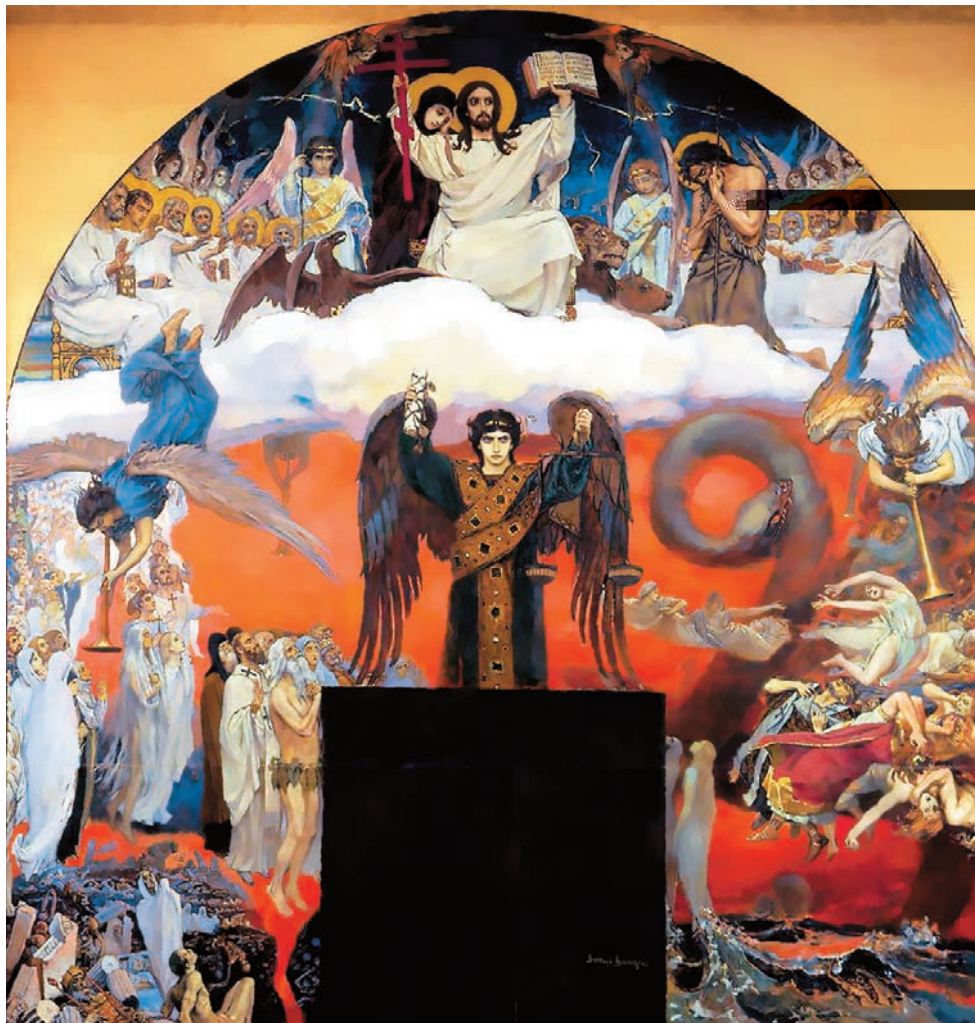
СТРАШНЫЙ Суд , Владимирский собор, Киев. Художник В. М. Васнецов. 1885-86 гг.