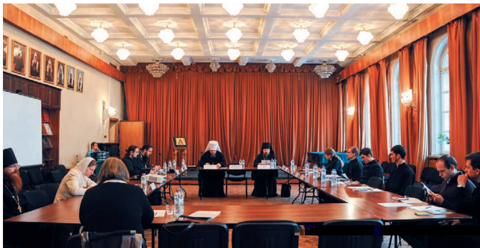
НА ПЛЕНАРНОМ заседании семинара в Актовом зале Издательского совета