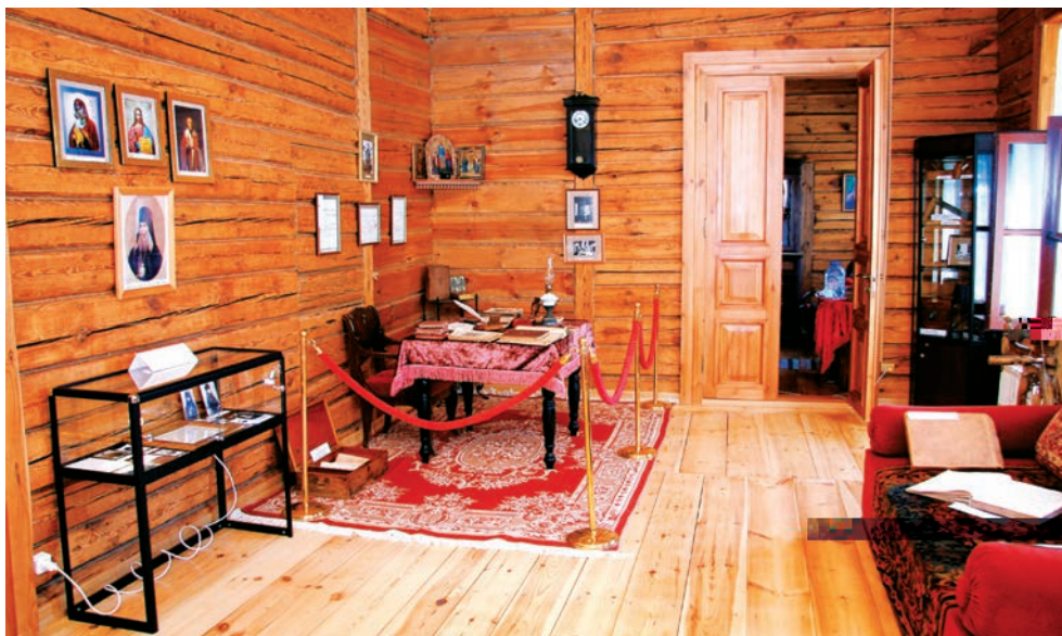
КЕЛЬЯ святителя Феофана Затворника в Вышенской пустыни

молиться и просить Господа о помиловании. Однако же и то верно, что Бог бережет береженого. Есть книжки, где прописано, какие брать предосторожности, и в газетах писали. Читайте и исполняйте. Сырого не есть, воду кипяченую пить» 33 . Другому адресату по поводу предстоящей операции на глазе он рекомендовал воспользоваться новым средством обезболивания: «Боли бояться нечего. Ныне нашли какой-то какоин [так в оригинале. — Прим. автора], который заглушает чувство, а оперируемый не чувствует совсем боли» 34 . Святитель внимательно следил за новыми открытиями и достижениями в области медицины. Своего адресата, у которого в 1891 году сын заболел туберкулезом,