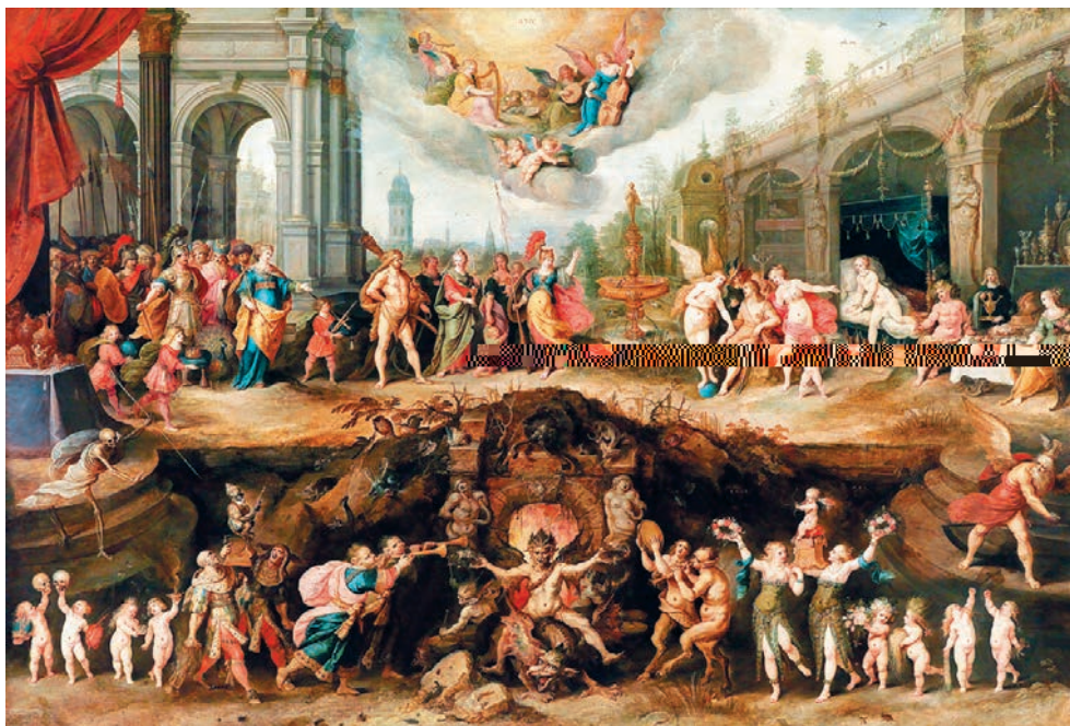
ЧЕЛОВЕК , делающий выбор между добродетелью и пороком. Художник Франс Франкен Младший. После 1635 г.

яснить, как естественный нравственный закон соотносится с понятием «совести», так как в святоотеческой литературе эти два понятия часто используются как синонимы.